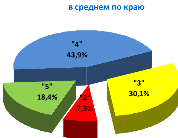
Диаграмма 1. Средний процент отметок за работу по русскому языку

На диаграмме 1 представлен средний процент отметок за работу среди общеобразовательных организаций края.